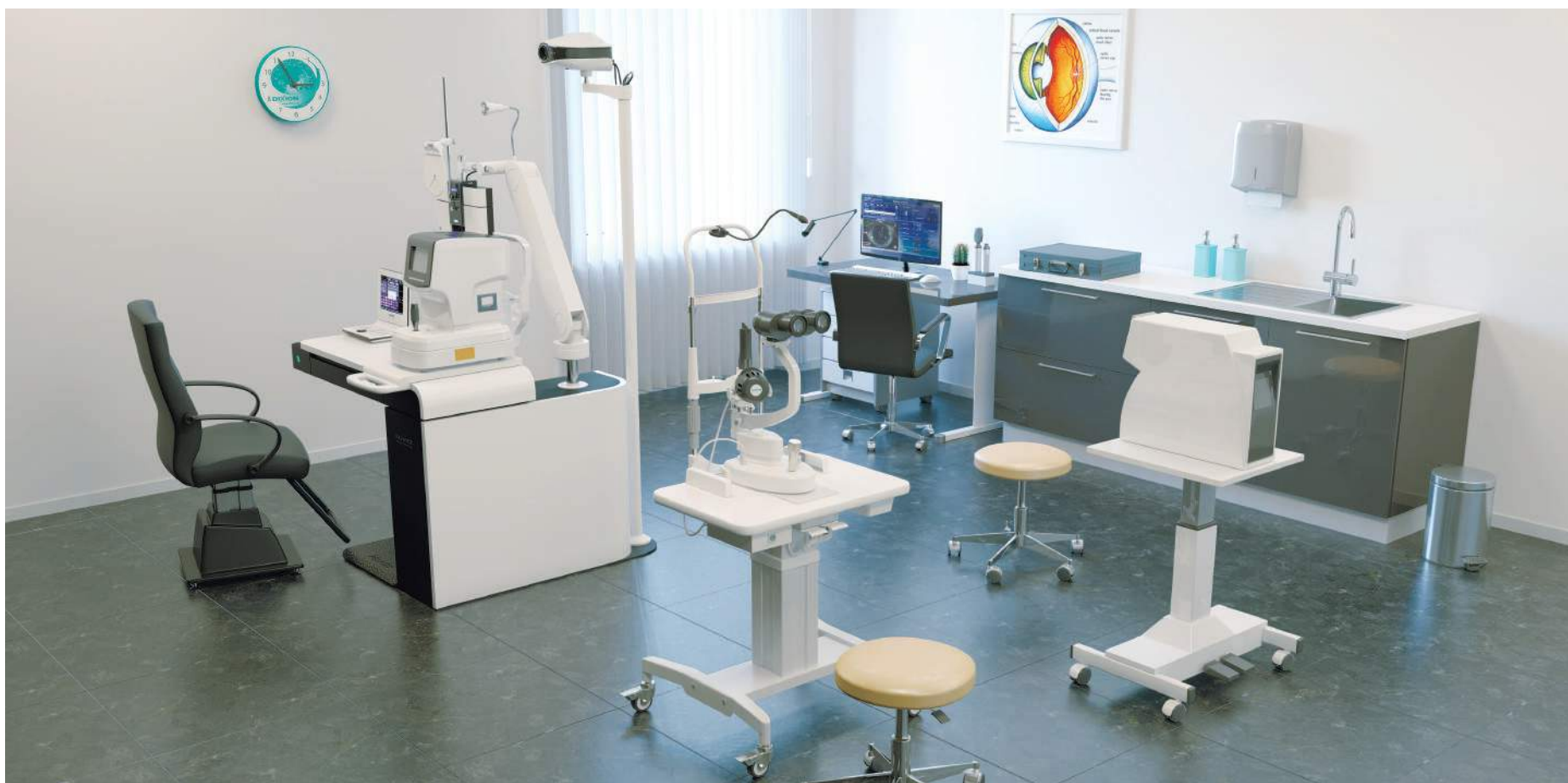
• Авторефрактометр Взор-9000